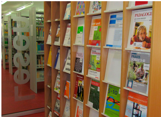
Aktuelle Zeitschriften finden Sie im Lesesaal

Als zentrale Einrichtung versorgen wir in erster Linie Angehörige der Pädagogischen Hochschule Karlsruhe mit Literatur zur Unterstützung des Studiums, der Lehre und der Forschung; aber auch Personen mit wissenschaftlichen und beruflichen Interessen können unsere Angebote nutzen.