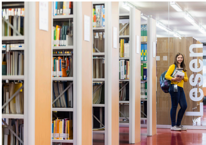
Die Hochschulbibliothek bietet ein großes Literaturangebot

Als zentrale Einrichtung versorgen wir in erster Linie Angehörige der Pädagogischen Hochschule Karlsruhe mit Literatur zur Unterstützung des Studiums, der Lehre und der Forschung; aber auch Personen mit wissenschaftlichen und beruflichen Interessen können unsere Angebote nutzen.